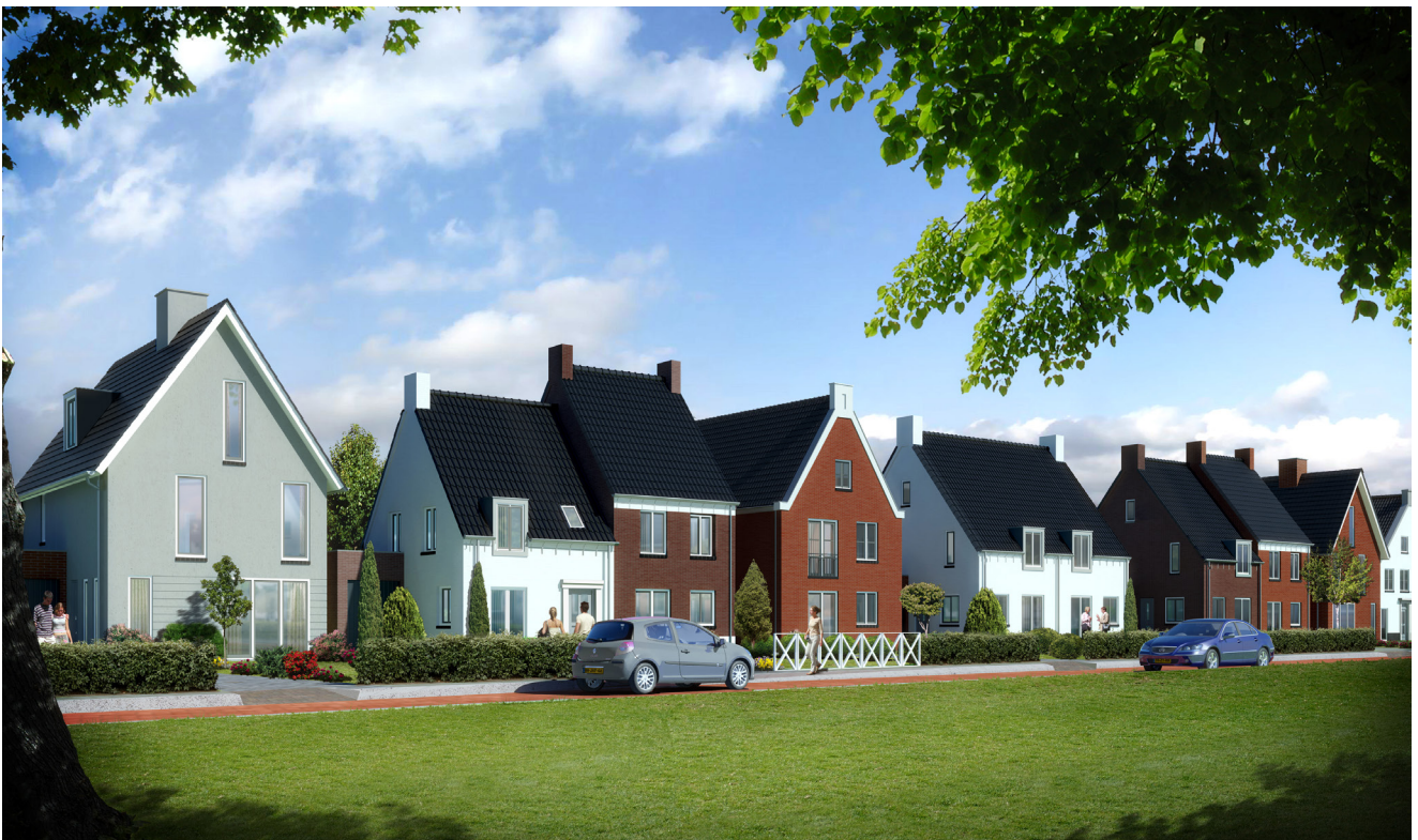
Voorbeeld romantisch wonen

De opdrachtgever heeft een volledige inbreng in de stijlkeuze en de uitwerking daarvan.