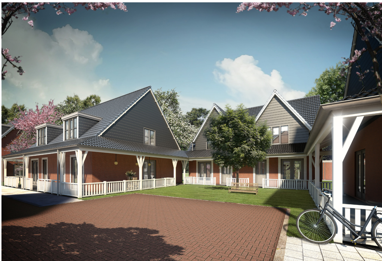
Voorbeeld recreatief wonen

Na zo'n 40 gerealiseerde projecten waarbij consumentgericht bouwen op één of andere manier een issue was, denken wij de rode draad met de hoogste slagingskans te pakken te hebben.