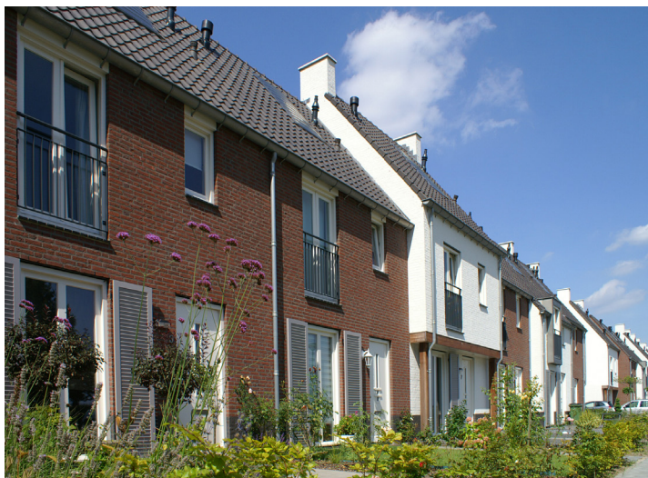
Voorbeeld traditionele stijl

Bouwman Swinkels Architecten is een middelgroot architectenbureau dat is gevestigd in Vught. Wij zijn actief in bijna alle sectoren van de bouw.